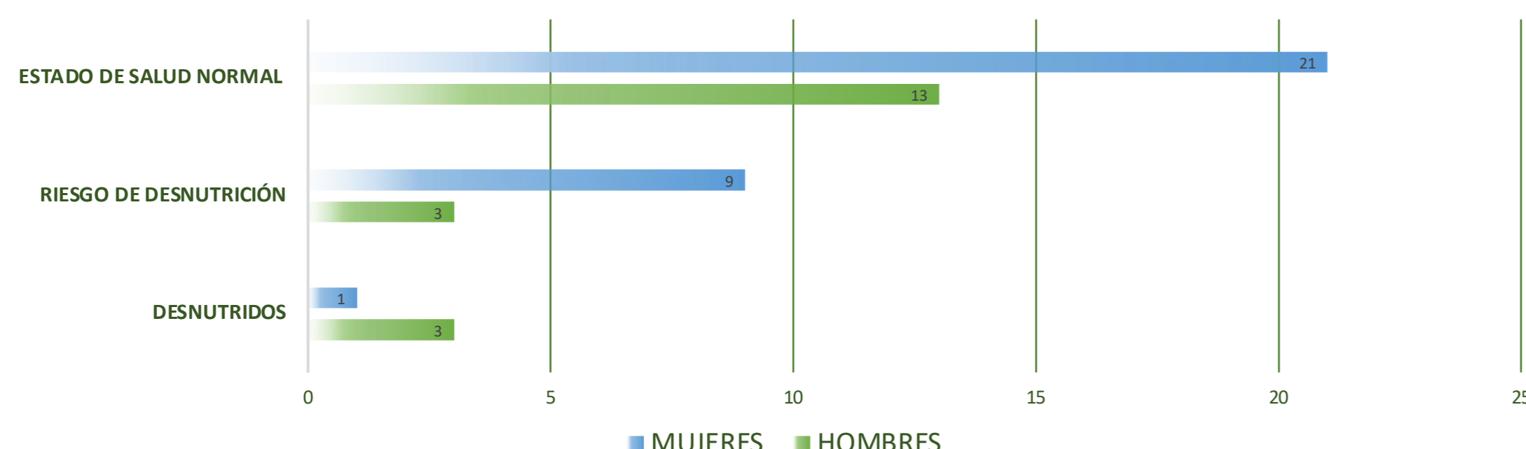
Fig 1: Estado nutricional de la población de estudio (nº de individuos).

Según el MNA de las 50 personas encuestadas, 4 de ellas (un 8%) se encontraban en situación de desnutrición , 12 (24%) estaban en riesgo de desnutrición , mientras que 34 (68%) presentaban un estado nutricional normal . (Fig. 1)