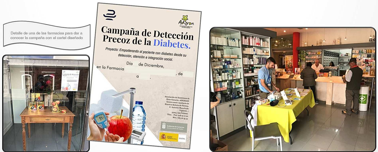
Detalle de una de las farmacias para dar a conocer la campaña con el cartel diseñado

RESULTADOS De los 639 usuarios que participaron se extrae que un 20% ya estaban diagnosticados de diabetes previamente y recibieron asesoramiento en hábitos saludables. Del resto no diagnosticado de diabetes un 14% padecía un alto riesgo de padecer diabetes. Se les asesoró en hábitos saludables y recomendó acudir a su médico. Además a un 23% se les realizó la hemoglobina glicosilada resultando que de cada 10 pruebas, 7 estaban por encima de un 6% por lo que fueron derivados directamente al médico.